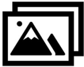
Imagen y Producción